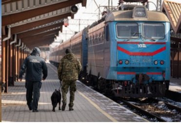
dworzec w Przemyślu