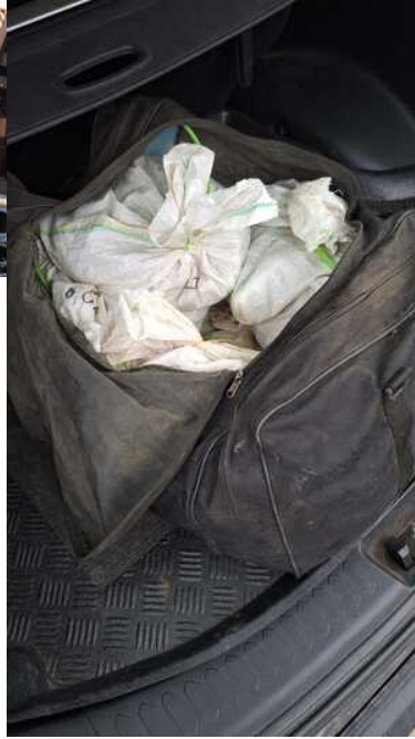
pakunek z ujawnionym bursztynem