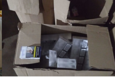
zdjęcia z realizacji sprawy