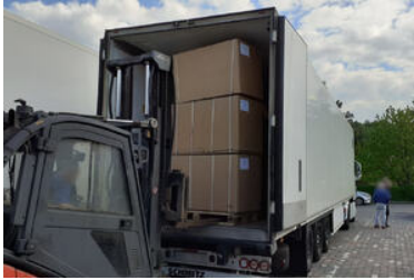
zdjęcia z realizacji sprawy