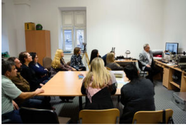
Spotkanie funkcjonariuszy BiOSG z przedstawicielami PUW