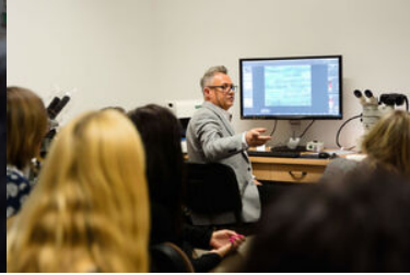
Spotkanie funkcjonariuszy BiOSG z przedstawicielami PUW