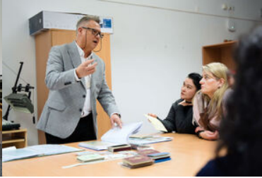
Spotkanie funkcjonariuszy BiOSG z przedstawicielami PUW