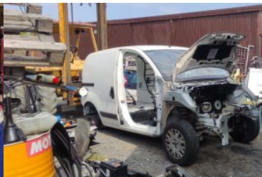
Warsztat samochodowy w którym ujawniono skradzione przedmioty