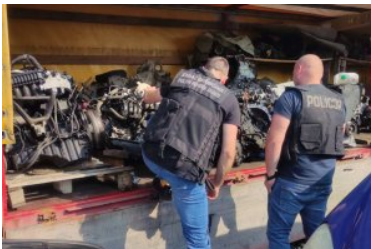
Warsztat samochodowy w którym ujawniono skradzione przedmioty