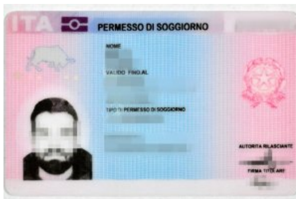
ujawniony fałszywy dokument