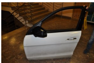
Obywatel Ukrainy usiłował przenieść... przez piesze przejście graniczne w Medyce drzwi Mercedesa