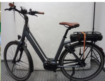
Kradziony rower elektryczny zatrzymany na przejściu granicznym