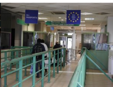
Medyka - przejście piesze