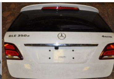
Obywatel Ukrainy usiłował przenieść... przez piesze przejście graniczne w Medyce pokrywę bagażnika Mercedesa