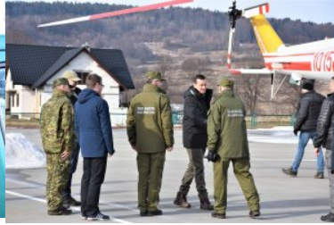
Wizyta w PSG w Huwnikach