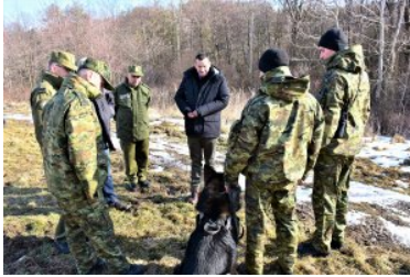
Spotkanie z patrolem SG