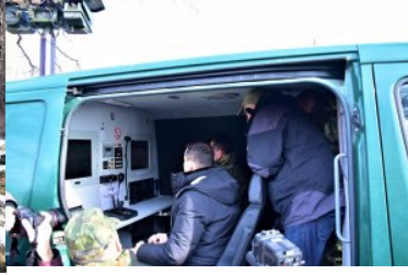
Prezentacja pojazdu obserwacyjnego SG