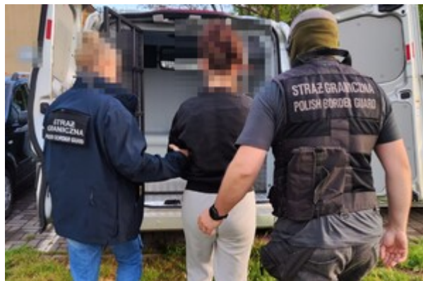
zdjęcia z realizacji sprawy

Łącznie w działania zaangażowanych było ponad 120 funkcjonariuszy SG z Bieszczadzkiego, Nadwiślańskiego Oddziału SG oraz Komendy Głównej SG.