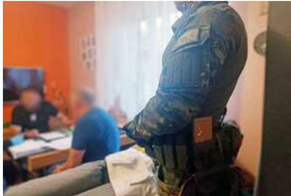
zdjęcia z realizacji sprawy