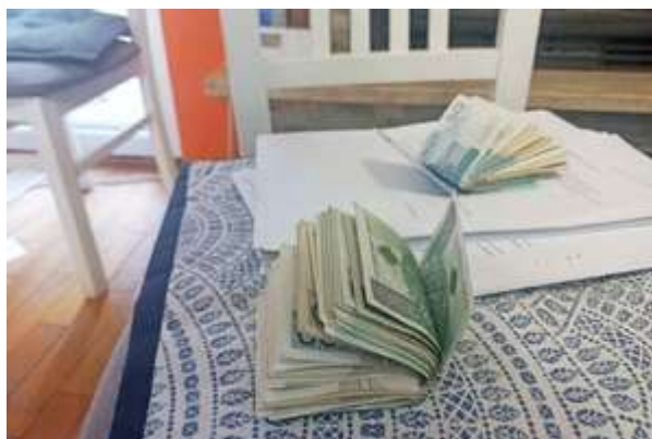
zdjęcia z realizacji sprawy