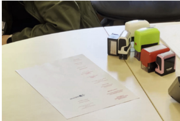
zdjęcia z realizacji sprawy