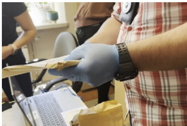
zdjęcia z realizacji sprawy