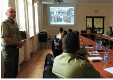
Odprawa w komendzie BiOSG