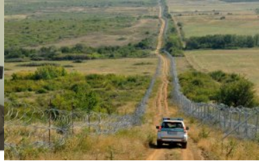
patrol na granicy macedońsko-greckiej